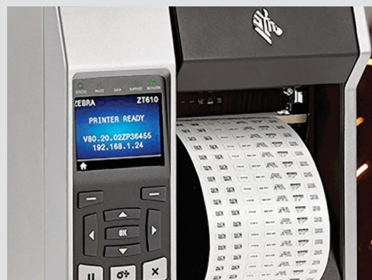
Compatibilidad del material

Evaluación estricta de la durabilidad, desempeño y calidad de impresión de cada cinta seleccionada: