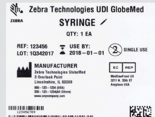
Desempeño con formatos de etiqueta complejos