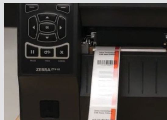
Desempeño de velocidad de impresión