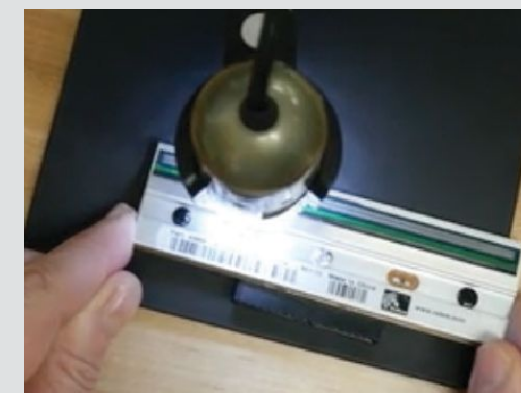
Acumulación de recubrimiento de fondo de la cinta